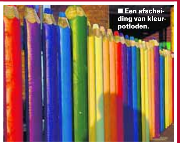
■ Een afscheiding van kleurpotloden.

'H ET BESTE BUITENBOEK' is een tuinboek dat niet over bloemen en planten gaat. Het gaat over de harde materialen, die onze tuin voor een groot deel bepalen, en aanzienlijk minder makkelijk te vervangen zijn dan een verkeerd gekozen plant. Wendy Hendriksen en Paul Scholte fotografeerden ideeën voor schuttingen, hekken, muren, bestrating, verlichting, schuurtjes, kindershuisjes en fantasiebouwwerken en geven suggesties als gordijnen op het terras en kunst tegen de saaie achtermuur.