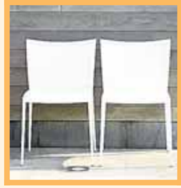
■ Duo-zitten, decoratief en gezellig.