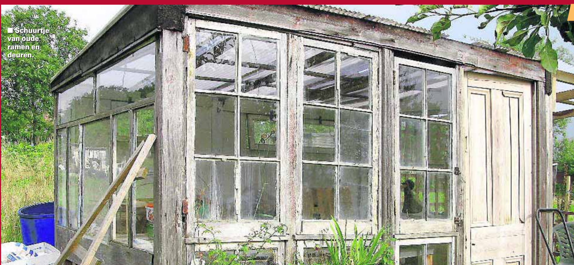
■ Schuurtje van oude ramen en deuren.

'H ET BESTE BUITENBOEK' is een tuinboek dat niet over bloemen en planten gaat. Het gaat over de harde materialen, die onze tuin voor een groot deel bepalen, en aanzienlijk minder makkelijk te vervangen zijn dan een verkeerd gekozen plant. Wendy Hendriksen en Paul Scholte fotografeerden ideeën voor schuttingen, hekken, muren, bestrating, verlichting, schuurtjes, kindershuisjes en fantasiebouwwerken en geven suggesties als gordijnen op het terras en kunst tegen de saaie achtermuur.