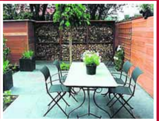
■ Wand met hardhout als onderdeel van de schutting.