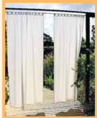
■ Gordijnen tussen het terras en de tuin voor meer privacy.

Volgens Wendy worden schuttingen en hekwerken om de tuin steeds hoger. „Ze waren 1,70-1,80 en zijn nu 2 meter. In België al 2,20 meter. Je vrij voelen op je eigen plek is een oerbehoefte. Kies dan wel iets moois of apart voor de afscheiding. Een betonnen muur kun je schilderen of je kunt er een raam in maken. Ik heb houten schuttingen gezien, die volgehangen waren met bloempotten of gemaakt van paaltjes in de