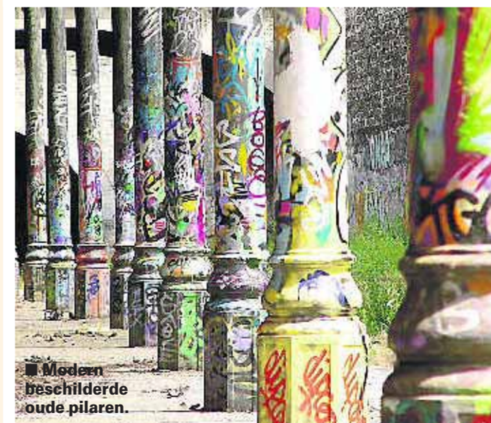
■ Modern beschilderde oude pilaren.