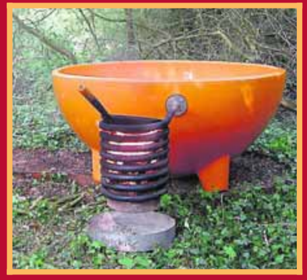
■ Buitenbad met verwarming.