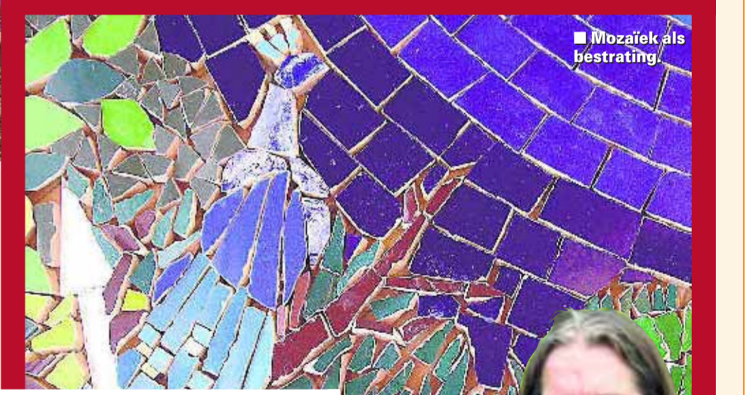
■ Mosaic als bestrating.